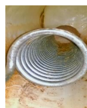
Après la révision