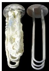
Corps de chauffe électrique, avant et après le détartrage. C'est une résistance électrique qui s'échauffe au passage de l'électricité.

On ne se contamine pas en avalant l'eau, mais en respirant les gouttelettes d'eau infectées en suspension dans l'air (aérosols), par exemple lors d'une douche. Dans une eau de moins de 20°C, les légionelles ne se développent pas. Et à partir de 55°C, elles commencent à mourir. Ainsi, on recommande que le chauffe-eau atteigne régulièrement une température d'au moins 60°C, et que l'eau qui circule dans les conduites ait une température d'au moins 55°C (pour atteindre au moins 50°C à la sortie du robinet). Par sécurité, les installations de chauffage modernes sont généralement programmées pour élever régulièrement – mais temporairement – la température du chauffe-eau au-dessus de 60°C pour tuer les bactéries.