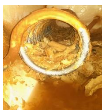
Avant la révision